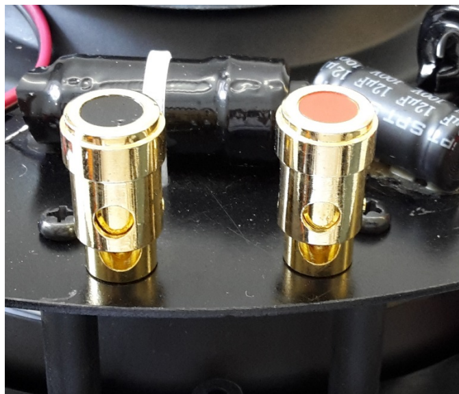
Borniers à poussoir plaqués or