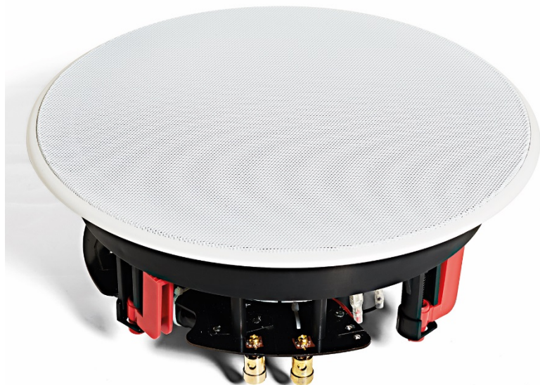
C6 & C8