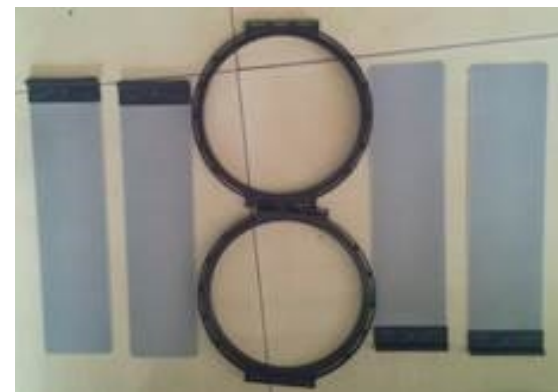
Gabarit avec ailes en alu